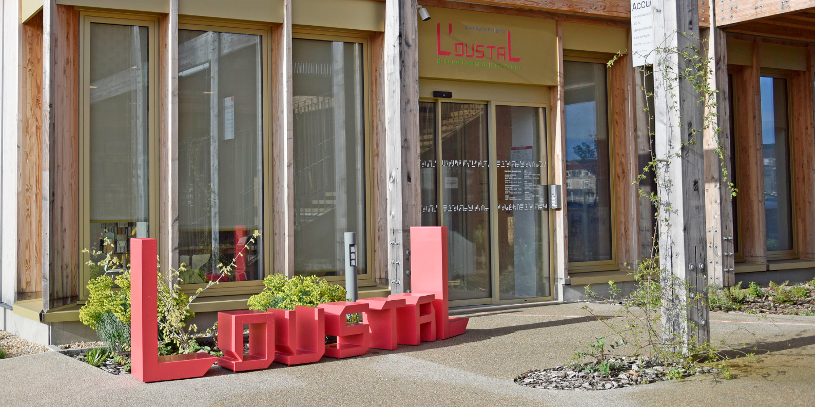
Entrée visiteurs du bâtiment Nord hébergeant le CAUE 24