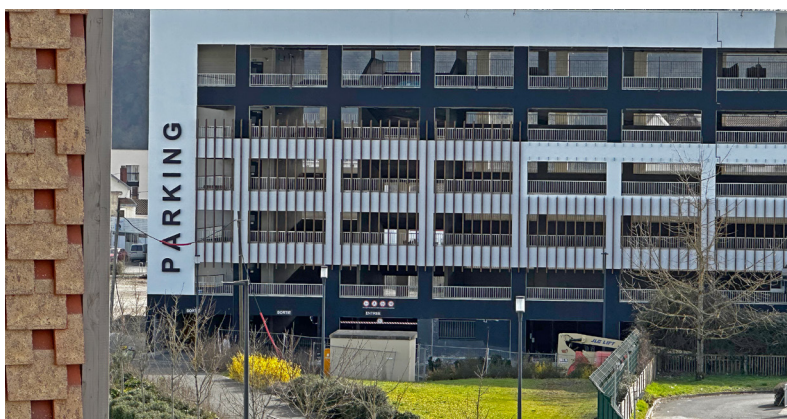
Vue depuis l'Oustal sur le parking