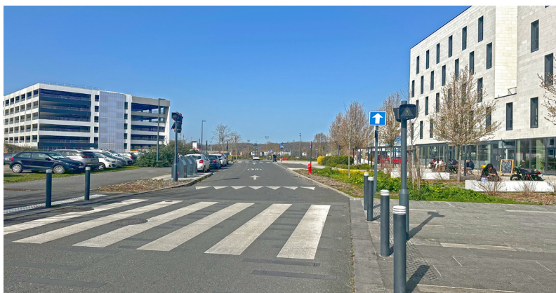
Entrée du quartier d'Affaires depuis l'Avenue du Maréchal Juin