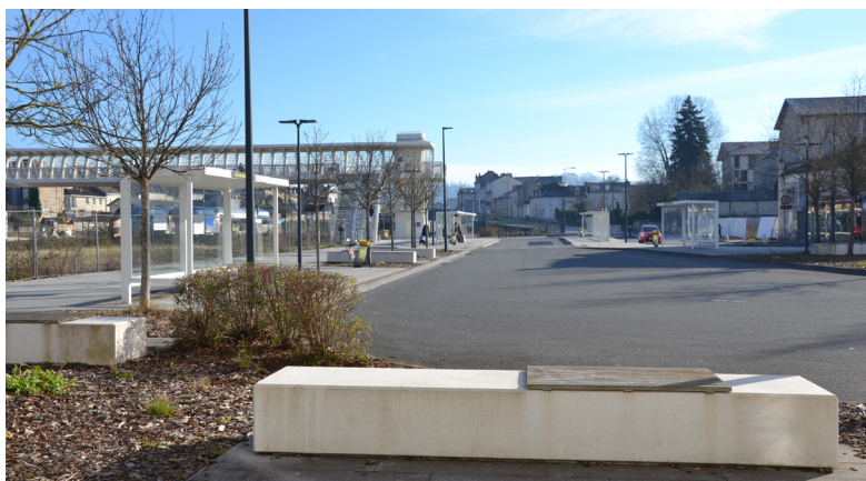
Pôle d'Échange Multimodal (PEM) et passerelle Simone Veil