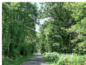
forêt de chênes pubescents