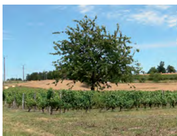
jouelle et pommier