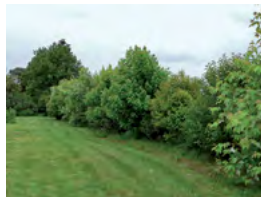
haie champêtre libre

Aubépine monogyne Bourdaïne Cornouiller sanguin Eglantier Fusain d'Europe Prunellier Rosa canina Sureau noir Viorne lantana