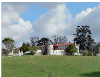
patrimoine de grands arbres