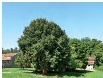
tilleul, l'arbre isolé le plus représenté

Spontanées (Chêne, Pin, Aulne, Noisetier, Genévrier...) ou anciennement plantées et cultivées (Cèdre, Tilleul, Marronnier, Noyer, Figuier), ces essences constituent l'écrin végétal des constructions. Particulièrement lisible autour du patrimoine ancien, il mérite d'être développé aux abords des constructions récentes.