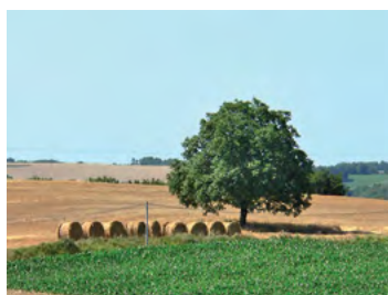
noyer en limite de parcelle