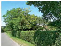
haie champêtre taillée

Alisier torminal Cytise Charme Chênes pubescent Erable champêtre Noisetier Saul blanc