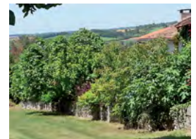
figuiers, sumac de Virginie...

Buddleia Deutzia Kolkwitzia Lilas Perowskia Seringat Spirée Viorne Weigelia