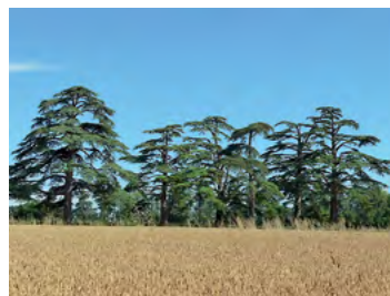
allée de cèdres du Liban