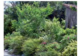
talus planté d'arbustes

Bignone Glycine Rosier grimpant Passiflore Vigne vierge Vigne