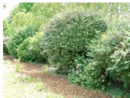
spontanés et horticoles