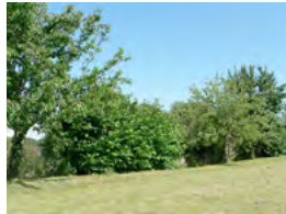
haie de petits fruitiers