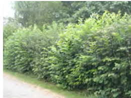
haie champêtre : Noisetier, Charme, Houx