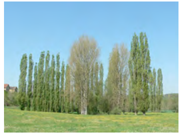
rideau de peupliers d'Italie