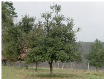
Chêne vert, Chêne truffier