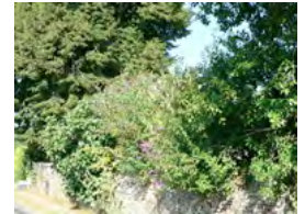
haie libre : Buddleia, Troène, Figuier