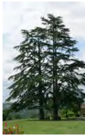
Cèdre du Liban