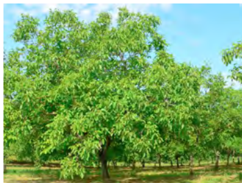
verger de noyers à fruits

Les pratiques anciennes de polyculture, ont fortement marqué le paysage par la plantation de vergers de noyers, de châtaigniers, de truffières de chênes ou de noisetiers et de haies de fruitiers. Ces fruitiers, arbres de petite taille à la croissance facilement maîtrisable, offrent de nombreuses couleurs avec leur feuillage et leur floraison spectaculaire.