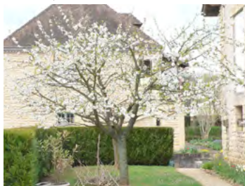
floraison printanière du pommier