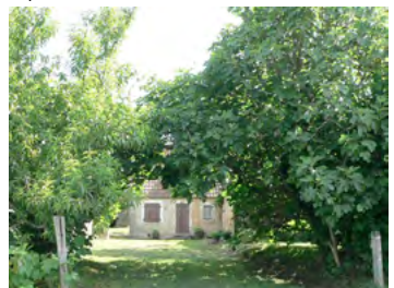
Pêcher et Figuier