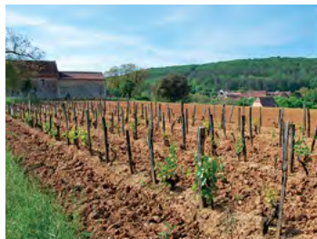
jouelle de vigne