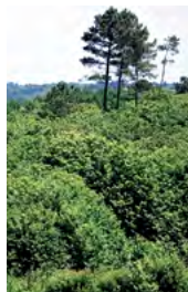
pins et châtaigniers