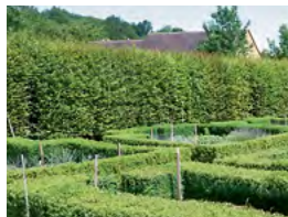
buis et charmes

Alisier torminal Aulne Charme Chêne pubescent Chêne vert Erable champêtre Noisetier Saulé marsault