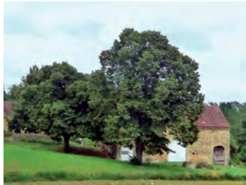
tilleul, l'arbre le plus représenté de la ferme

Le cèdre de l'Atlas et bien d'autres essences (magnolia, pin parasol, palmier...) importés au XIX e siècle, ornent les jardins des bourgs ou les abords d'une propriété cossue.