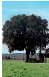
chêne vert, persistant