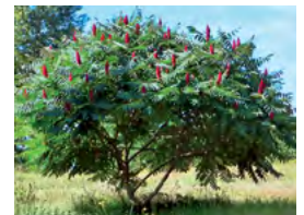
sumac de Virginie

Buddleia Deutzia Kolkwitzia Lilas Perowskia Seringat Spirée Sumac de Virginie Viorne Weigelia