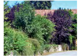
haie libre, feuillage décoratif