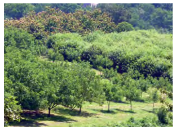
petits vergers de noyers et de châtaigniers