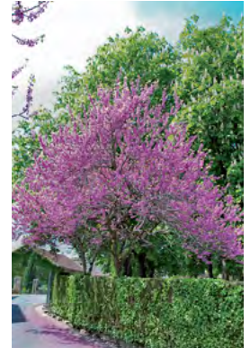
arbre de Judée

Cèdre de l'Atlas Chêne rouge Cytise If commun Marronnier Noyer à fruit ou à bois Platane commun Tilleul Saulé blanc Les arbres < 15 m : Arbre de Judée Catalpa Fruitiers : Figuiers, Pommier, Cerisier, Pêcher, Prunellier... Lagerstroemia Magnolia soulangiana