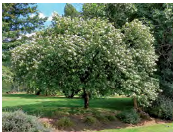
pommier isolé, en verger, en alignement