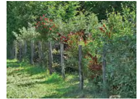
arbustes colorés et persistants