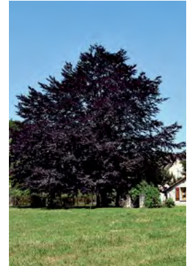
hêtre pourpre s'adaptant à tous les sols

Arbre de Judée Figuier fruitiers : Pommier, Cerisier, Pêcher, Prunellier... Lagerstroemia Magnolia soulangiana