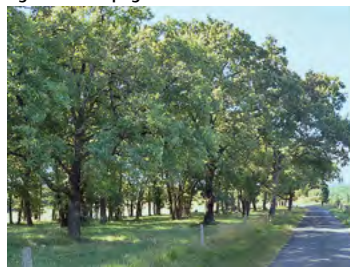
taillis de chênes