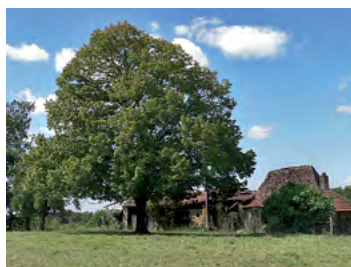
tilleul, l'arbre isolé le plus représenté

La silhouette et l'essence des arbres sont des repères importants dans le paysage et dans la compréhension du territoire. Spontanées (chêne, frêne, noisetier, genévrier...) ou anciennement plantées et cultivées (cèdre, tilleul, marronnier, noyer, figuier), ces essences constituent l'écrin végétal des constructions. Particulièrement lisible autour du patrimoine ancien, il mérite d'être développé aux abords des constructions récentes. Autres que ces essences rurales d'autres arbres sont utilisés en milieu plus urbain tel que le platane qui, en alignement (route), ou en place plantée (mail) accompagne des espaces publics importants. Le cèdre de l'Atlas et autres essences importées au XIX e (magnolias, lilas d'Inde...) se rencontrent dans les jardins de ville et représentent une propriété cossue.