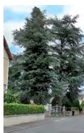
cèdre de l'Atlas