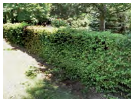
haie champêtre taillée