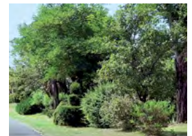
haie étagée et arborée

Buddleia Deutzia Kolkwitzia Lilas Perowskia Seringat Spirée Viorne Weigelia