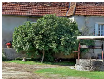
figuier accompagnant un mur