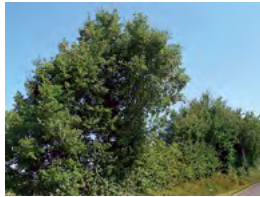
haie champêtre libre

Aubépine monogyne Bourdaïne Cornouiller sanguin Eglantier Fusain d'Europe Prunellier Rosa canina Sureau noir Viorne lantana