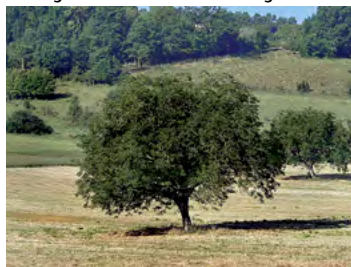
noyer en isolé ou en verger