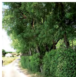
chênes et érables champêtres