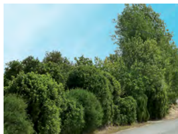
mélanges persistants, caducs, taillés et libres

Des vergers et des alignements de petits fruitiers (poirier, cerisier, pêcher...) sont présents à l'entrée des fermes, des bourgs et complètent les potagers. Glycines, bignonnes et de nombreuses variétés de rosiers colorent les abords des habitations.