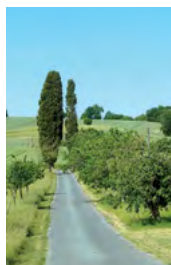
fruitiers et ifs