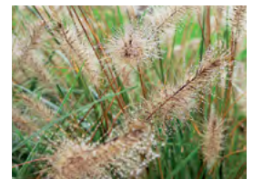
les graminées (pennisetum, fétuque, miscanthus...), graphiques et colorées, entretien facile