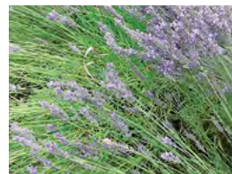
les plantes aromatiques, (lavande, thym, romarin, sauge...), utiles, persistantes et florifères

✓ des dispositions particulières concernent les plantations et les essences dans le règlement d'un Plan Local d'Urbanisme ou d'un lotissement ✓ des essences sont prohibées aux abords des constructions dans les secteurs couverts par les prescriptions «retrait et gonflement d'argiles» ✓ se méfier du coup de cœur dans une pépinière et des cadeaux des amis qui ignorent vos bonnes résolutions.