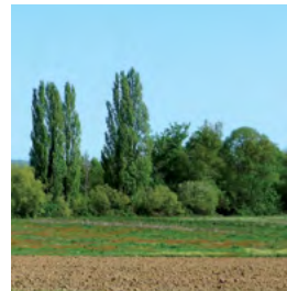
ripisylve : peupliers, frênes, aulnes...