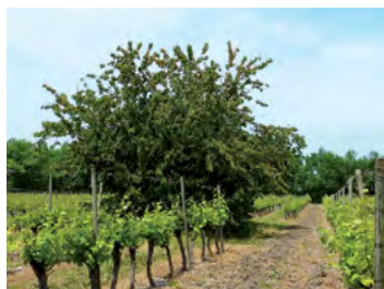
vignes et cerisiers