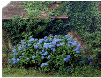
hortensia en sol acide