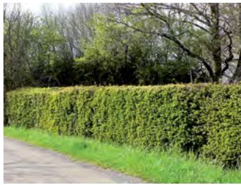
haie de buis