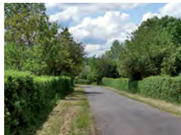
haie champêtre, aubépine