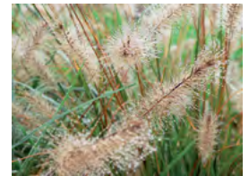
les graminées (pennisetum, fétuque, miscanthus...), graphiques et colorées, entretien facile