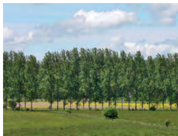
rideau de peupliers

Intégrer ce patrimoine végétal dans la composition des jardins est une façon de perpétuer l'identité locale.