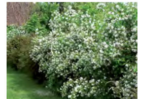
haie libre avec du seringat