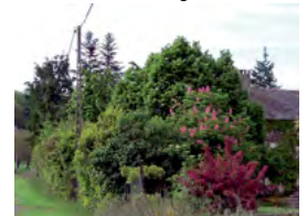
haie libre : lilas, troène, weigela...