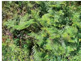
haie de fougère aigle