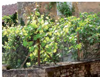
figuier et vigne en sol calcaire