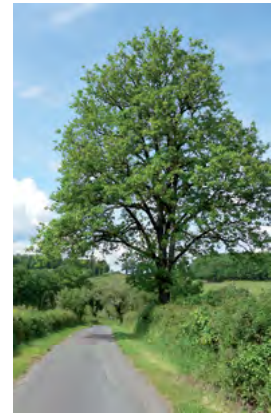
chêne pédonculé isolé

Bignone Glycine Houblon Rosier grimpant Passiflore Vigne vierge