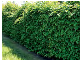
haie de charmes taillée

Aulne Charme Chêne pubescent, sessile et tauzin Erable champêtre Erable de Montpellier Noisetier Saule