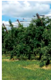
verger de pommiers