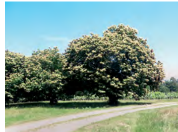
ancien verger de châtaigniers