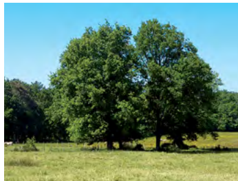
couple de chênes au milieu de la prairie