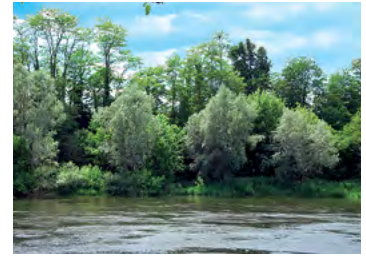
ripisylve de la Dordogne : saule, aulne...