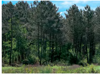
forêt du Landais