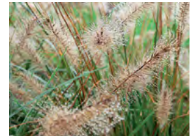
les graminées (pennisetum, fétuque, miscanthus...), graphiques et colorées, entretien facile