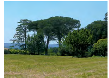
cèdre et pins parasols