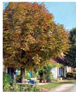
arbre maître sur cour ouverte