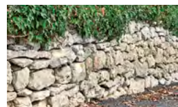
mur en pierre végétalisé