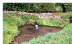
point d'eau aux abords du bâti