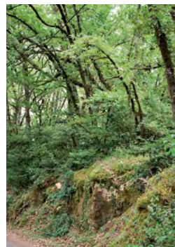
boisement du causse