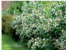
haie champêtre libre

Aubépine monogyne Bourdaïne Cornouiller sanguin ou mâle Eglantier Erable de Montpellier Fusain d'Europe Prunellier Rosa canina Sureau noir Viorne lantana