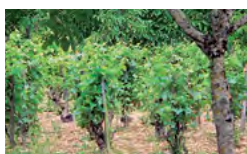
rangs de vignes et fruitiers