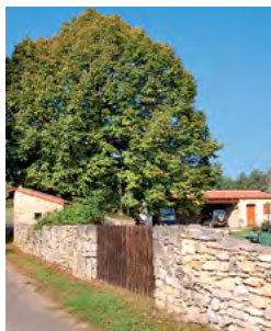
arbre maître sur cour fermée

La silhouette et l'essence des arbres sont des repères importants dans le paysage et dans la compréhension du territoire. Spontanées (chêne, frêne, cèdre, genévrier...) ou anciennement plantées et cultivées (tilleul, marronnier, if, figuier), ces essences constituent l'écrin végétal des constructions. Particulièrement lisible autour du patrimoine bâti ancien, il mérite d'être développé aux abords des constructions récentes.