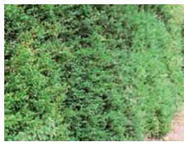
haie de buis