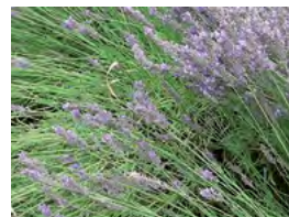
les plantes aromatiques, (lavande, thym, romarin, sauge...), utiles, persistantes et florifères

Cette végétation basse, aux feuillages et floraisons très variés, permet d'agrémenter l'ensemble du jardin tout au long des saisons.