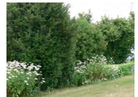
haie étagée et arborée

Abélia Escallonia Fusain fortunei Laurier tin Oranger du Mexique Photinia