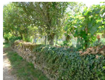
vigne et potager fermé