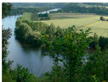
polyculture et berges boisées de la Dordogne