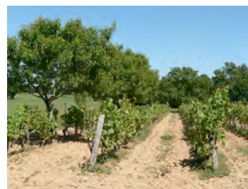
parcelle de vigne