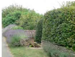
haie mélangée et lavande