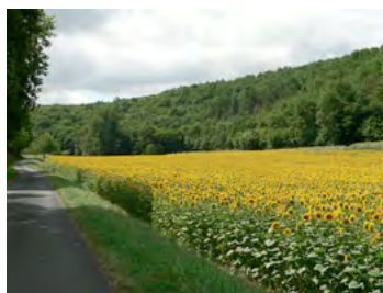
champ de tournesol