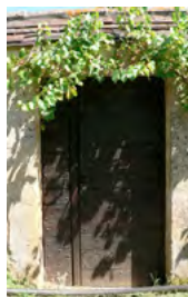
treille de vigne