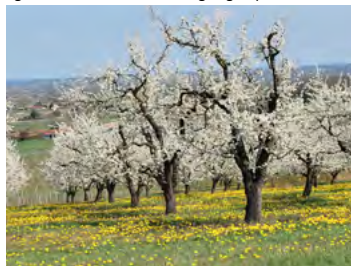
verger de Pruniers d'Ente

Le potager est très présent dans la vallée de la Dordogne aux abords des fermes ou dans les bourgs (tradition de maraîchage).