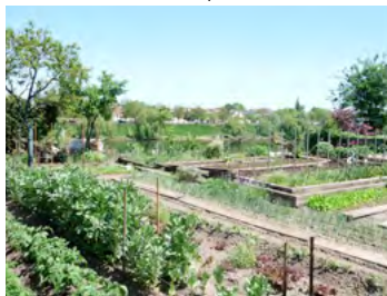
potager au bord de la Dordogne