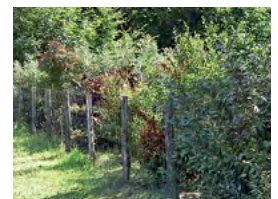
haie persistante et décorative

Deutzia Hortensia Indigofera Kolkwitzia Lila Perowskia Seringat Spirée Weigelia