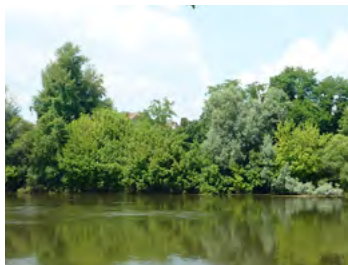
ripisylve de la Dordogne : saule, aulne...