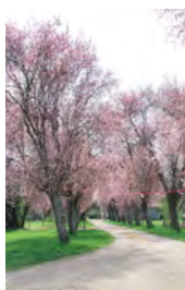
cerisier à fleurs