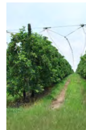
verger de pommiers