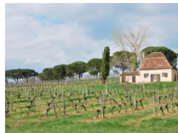
allée de pins parasols