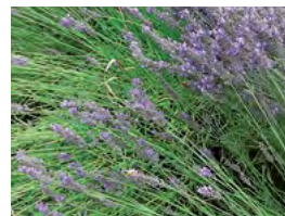
les plantes aromatiques, (lavande, thym, romarin, sauge...), utiles, persistantes et florifères