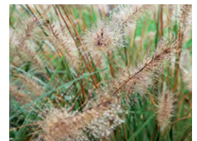
les graminées ( pennisetum, fétuque, miscanthus... ), graphiques et colorées, entretien facile

✓ des dispositions particulières concernent les plantations et les essences dans le règlement d'un Plan Local d'Urbanisme ou d'un lotissement ✓ des essences sont prohibées aux abords des constructions dans les secteurs couverts par les prescriptions «retrait et gonflement d'argiles» ✓ se méfier du coup de cœur dans une pépinière et des cadeaux des amis qui ignorent vos bonnes résolutions.