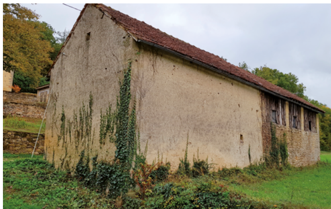
Granges mitoyennes avant travaux