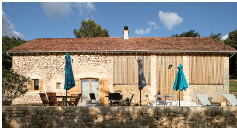
Transformation en gîte